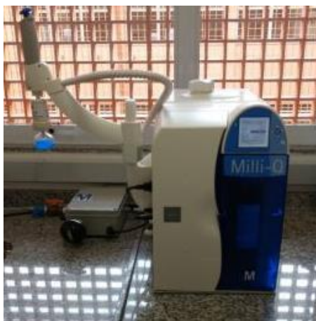
Figura 1: Sistema Milli-Q Direct 8 instalado na CEM-SBC

O sistema de purificação de água Milli-Q Direct 8 foi adquirido pela CEM-SBC em agosto de 2017, frente a uma demanda crescente dos pesquisadores da UFABC São Bernardo do Campo por água ultrapura e para utilização em processos de análise e manutenção na própria CEM-SBC. Desde sua instalação até o presente momento, este equipamento já obteve 443 solicitações de agendamento