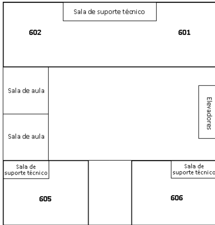
Figura 1: Disposição dos laboratórios no 6º andar do Bloco B - UFABC