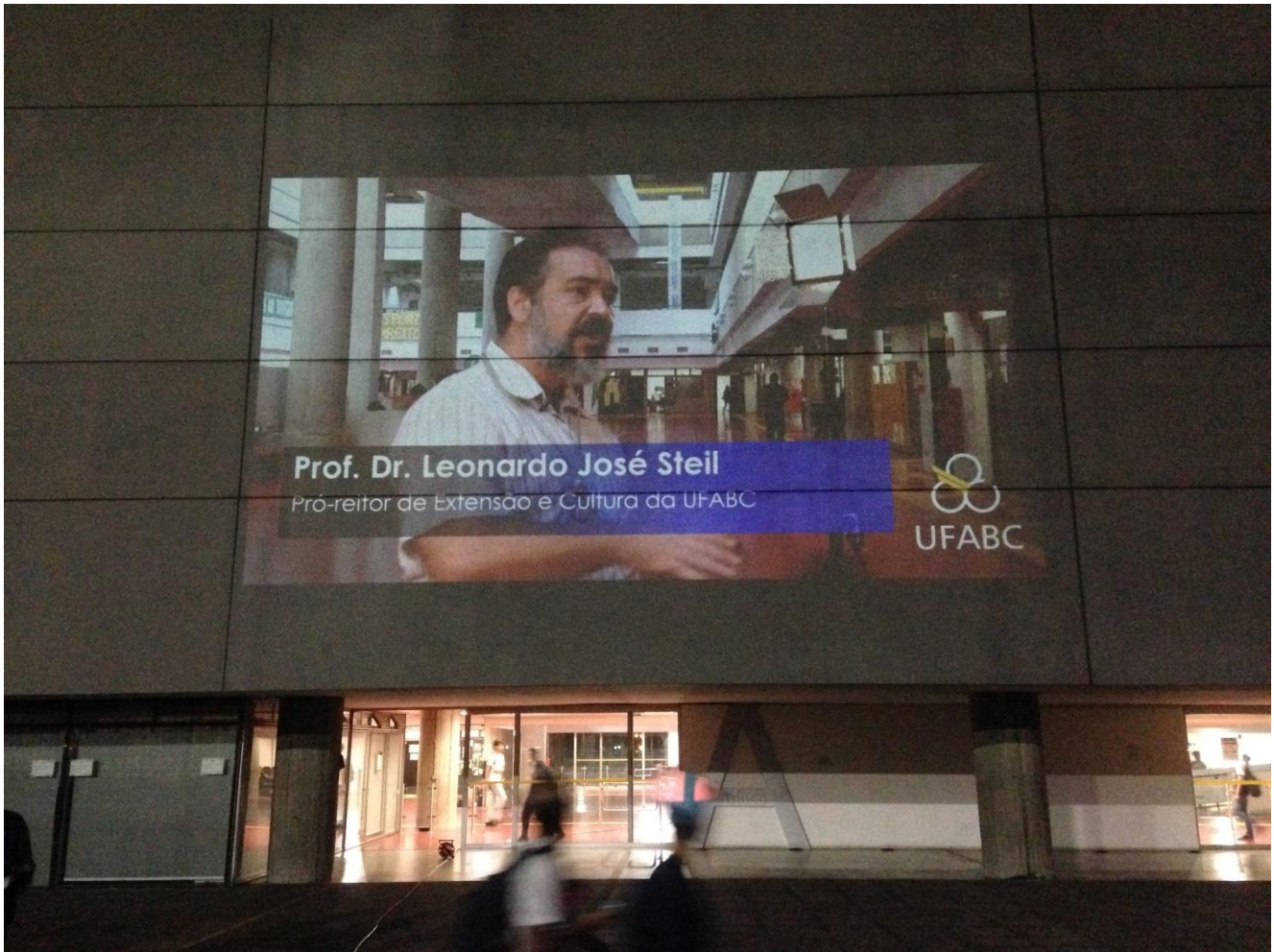
Configuração de Projeção na lateral do Bloco-A.